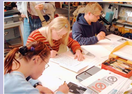
Echte Handarbeit: Menschen mit Down Syndrom erstellen zwei Mal jährlich die Zeitschrift „ohrenkuss“

Eine geistige Behinderung bedeutet nicht, dass diese betroffenen Personen weder lesen noch schreiben können. Dies beweisen die Redakteure der Zeitschrift „ohrenkuss“ immer wieder aufs Neue: Alle zwei Wochen trifft sich das Team in Bonn zu einer Redaktions-sitzung. Hier wird das neue Heft besprochen. Neben zwölf Bonnern schreiben rund 40 Fernkorrespondenten für „ohrenkuss“. Diese Zeitschrift erscheint zweimal pro Jahr und wird von Menschen mit Down Syndrom geschrieben. Die Texte schreiben sie selbst am Computer, mit der Hand oder auch per Diktat an einen Schreibassistenten. Zensiert oder korrigiert wird nichts. „ohrenkuss“ widmet sich Schwerpunktthemen: Liebe, Arbeit oder Mode wurden schon behandelt. Im Heft „Baby“ haben die Autoren über ihre