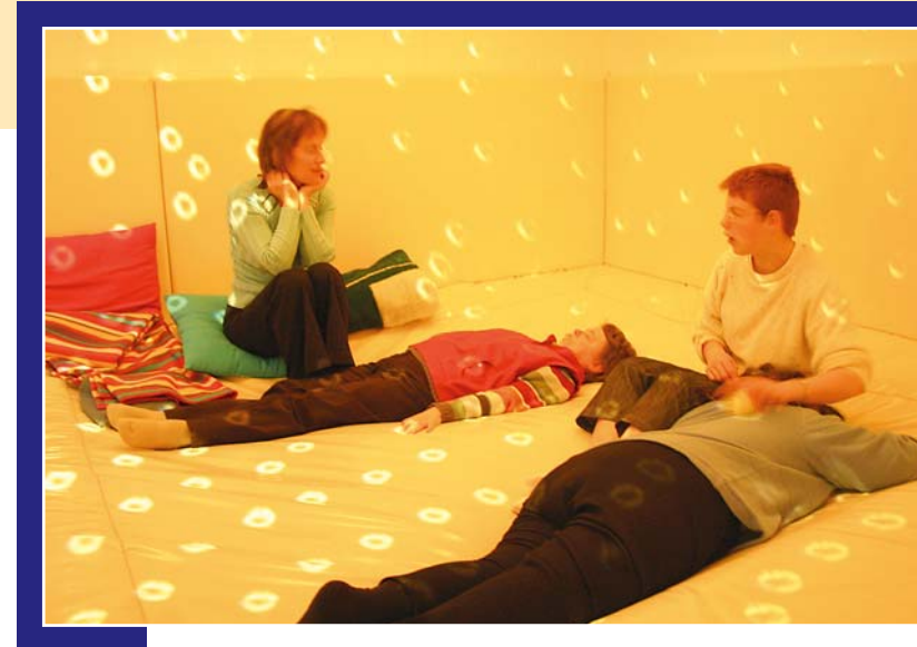
Herrliche Entspannung: Auf einer großen Wassermatratze liegen, dem Lichterspiel zuschauen, Klänge wahrnehmen und die Seele baumeln lassen ...

Die Krönung des Snoezelen ist jedoch der weiße Raum: Wassermatratze, Musik, Schwingungen, Lichtspiele über Wände und Decken, Wassersäulen – alle Zeichen stehen auf Erholung.