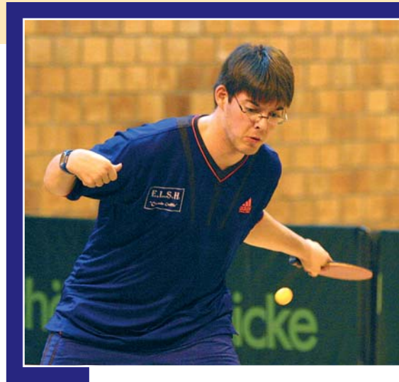
Wissenschaftlich belegt: Sport ist gut für Körper und Geist

Ja, Sport ist viel wichtiger als nur die Übungen zu machen und an-