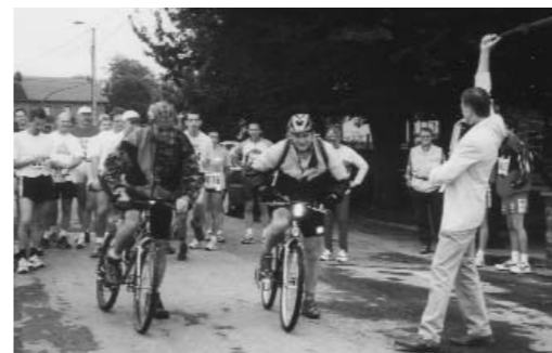
Der Erlös des 5. Sommerfestes „Gemeinsam in Bewegung“ ist für den Hof Peters bestimmt