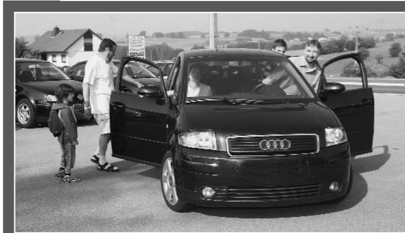
Einsteigen und mitfahren: Die neue "Fahr mit!"-Zentrale bietet ein Service-Plus in Zeiten sinkender Busverbindungen in der Eifel

Nach einem Forum der Nutznießer und Anbieter von Fahrdiensten anlässlich der Wallonischen Woche der Mobilität wurde auch vor dem Hintergrund der bedeutenden Verringerung des öffentlichen Personennahverkehrs deutlich, dass Menschen ohne