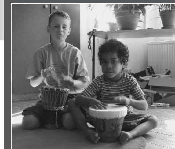
Wenn behinderte und nicht-behinderte Menschen etwas gemeinsam unternehmen, dann ist das für beide Seiten fruchtbar

Die auf diesen Seiten verwendeten Bildsymbole (PCS) sind urheberrechtlich geschützt © by Mayer-Johnson Co.