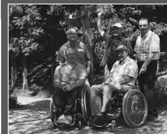
Ein Plus an Zugänglichkeit: Der Bütgenbacher Wanderweg „Rund um den See“ ist nun auch für Rollstuhlfahrer leichter zu bewältigen

Anschrift: Parc Merveilleux Bettembourg route de Mondorf L-3260 LUXEMBURG www.parc-merveilleux.lu