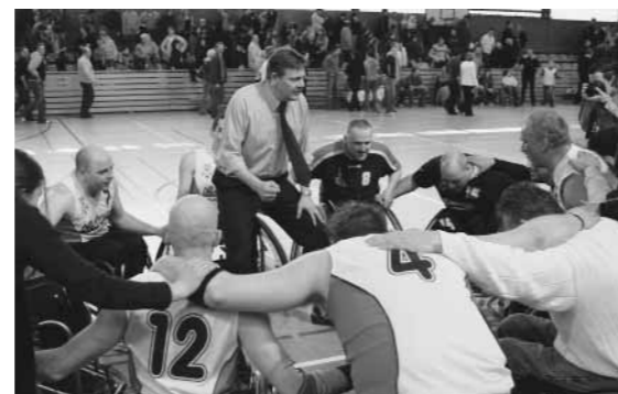
Sind im Pokalfinale: Die „Roller Bulls“ hoffen auf eine breite Unterstützung in Blankenberge

Anmeldungen nehmen Erika und Arnold Grün unter Tel. 080 / 64 24 51 bis zum 20. Mai entgegen.