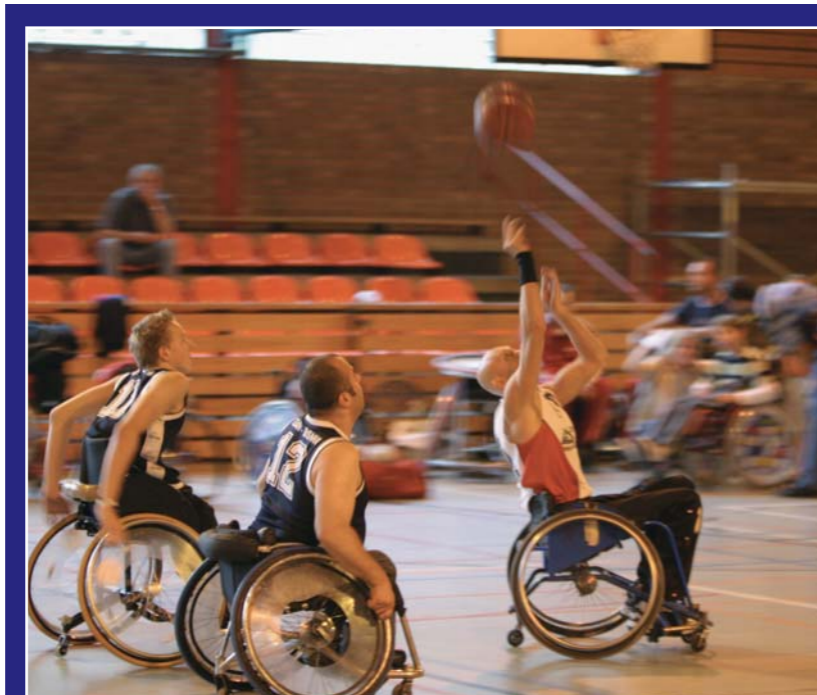
Purer Körpereinsatz: Aufgrund der schnellen Spielzüge zählt Rollstuhl-Basketball zu den beliebtesten Sportarten im Behindertenbereich

Ab sofort spielen die mehrfachen belgischen Meister und Pokalsieger aus der 1. Division statt im Lütticher Vorort Jupille im Sport- und Freizeitzentrum (SFZ) in St.Vith. Und dies aus gutem Grund: Bis auf Freunde und Fans der beiden Eifeler Spieler in Reihen der „Roller Bulls“ interessierte sich kaum jemand für die Rollstuhl-Basketballer in Lüttich. Entsprechend leer waren die Zuschauerränge in der Sporthalle von Jupille. Als dann im vergangenen Jahr die „Roller Bulls“ bei der 25-Jahr-Feier des BC St. Vith vor rund 350 Zuschauern im SFZ