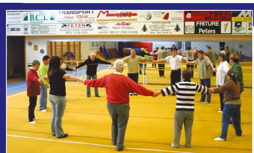
Spaß in der Gruppe: Menschen mit einer Behinderung der Tagesstätte Meyerode und der Lebenshilfe Tirol in der Sporthalle Amel

Ziel der Unterstützung durch die Arbeitsbegleiterin ist auch, Selbstbewusstsein und Selbstbestimmung der Frauen zu fördern. Dazu gehören auch das Erkennen der persönlichen und beruflichen Stärken sowie das Vermitteln dieser Stärken gegenüber Kollegen und dem Arbeitgeber.